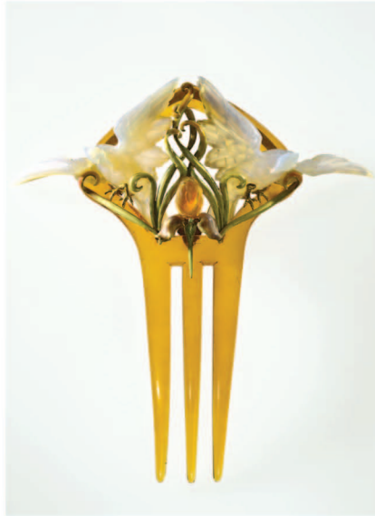
Philippe Wolfers, peigne Oiseaux et Iris, 1899 Acquisition, 2009, Musées Royaux d'Art et d'Histoire, Bruxelles

Avec son Album du Diable , Félicien Rops souhaitait présenter l'histoire de son temps en nu et demi-nu, où le héros de cette comédie humaine serait Satan. Le projet ne fut jamais achevé. Dans les coulisses est un des dessins préparatoires témoignant de la réflexion de Rops sur ce thème. Les dessins annoncent sa période satanique.