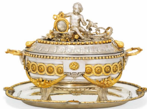
Joannes Cornelius Hendrickx, terrine, 1782 Acquisition, 2011, Zilvermuseum Sterckshof, Auvers

Cette série de cinq tableaux s'inscrit dans les « peintures-mots », dans lesquelles mot et images entrent en dialogue. Dans cette œuvre 'à quatre mains', l'écrivain devient peintre et le peintre se fait écrivain. De telles œuvres ont été réalisées pour la première fois dans le contexte du mouvement CoBrA, dont les deux artistes étaient d'éminents représentants.