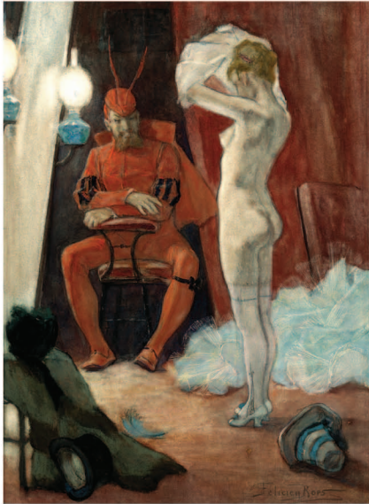
Félicien Rops, Dans les coulisses, vers 1878-1880 Acquisition, 2008, Musée provincial Félicien Rops, Namur

Avec son Album du Diable , Félicien Rops souhaitait présenter l'histoire de son temps en nu et demi-nu, où le héros de cette comédie humaine serait Satan. Le projet ne fut jamais achevé. Dans les coulisses est un des dessins préparatoires témoignant de la réflexion de Rops sur ce thème. Les dessins annoncent sa période satanique.