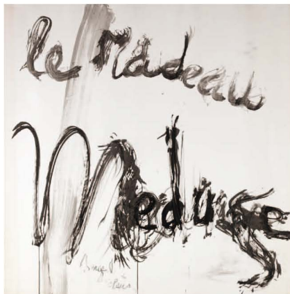
Hugo Claus et Serge Vandercam, Série Le radeau de la Méduse, 1964. Acquisition, 2008, Musées royaux des Beaux-Arts, Bruxelles

Cette collection réputée contient 85 pièces de faïence bruxelloise datant principalement du XVIII e siècle. Commencée au XIX e siècle, elle fut transmise de génération en génération. La transmission à la génération suivante aurait mené à la dispersion de l'ensemble. Le Fonds a donc décidé fin 2010 d'acheter la collection dans son intégralité.