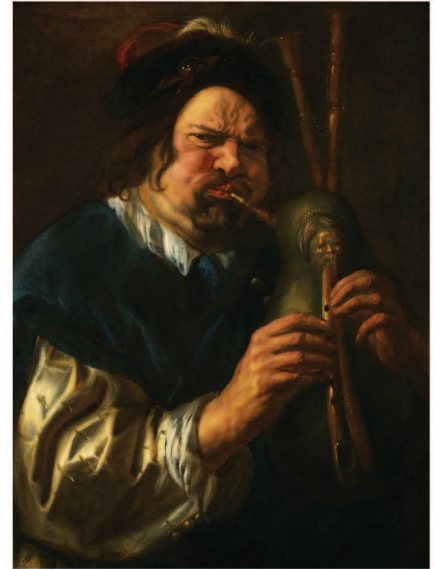
Jacob Jordaens, Le Joueur de cornemuse, 1640-45 Acquisition, 2009, La Maison de Rubens, Anvers

Pour autant que nous le sachions, Oiseaux et Iris est le seul peigne de Philippe Wolfers encore intact. Ce bijou art nouveau porte la marque des Exemplaires Uniques . Il est conservé dans son écrin d'origine, ce qui en fait une pièce remarquable. En outre, l'objet est bien documenté : le dessin préparatoire, daté, est également conservé.